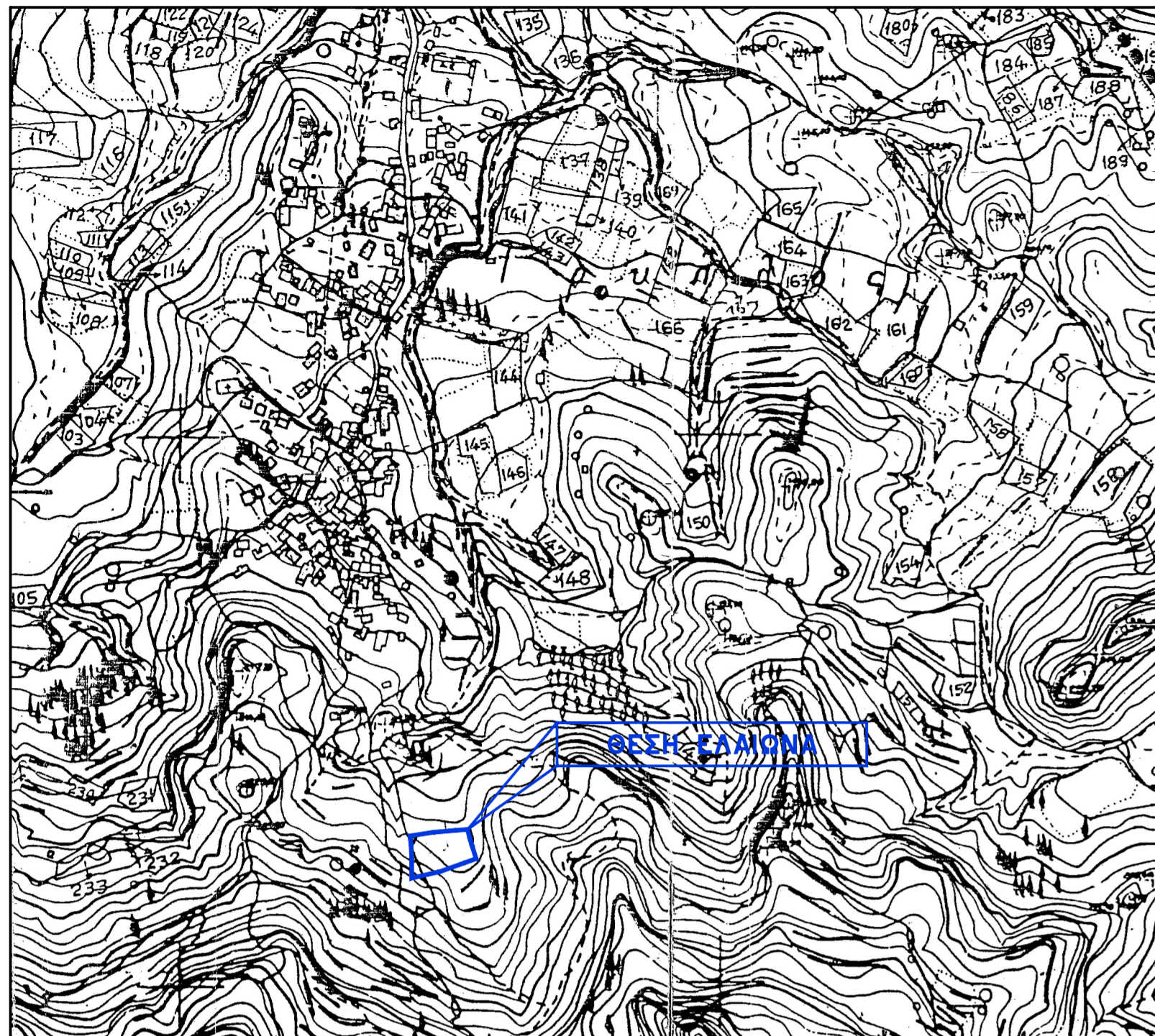
ΑΠΟΣΠΑΣΜΑ ΧΑΡΤΗ 1/50.000