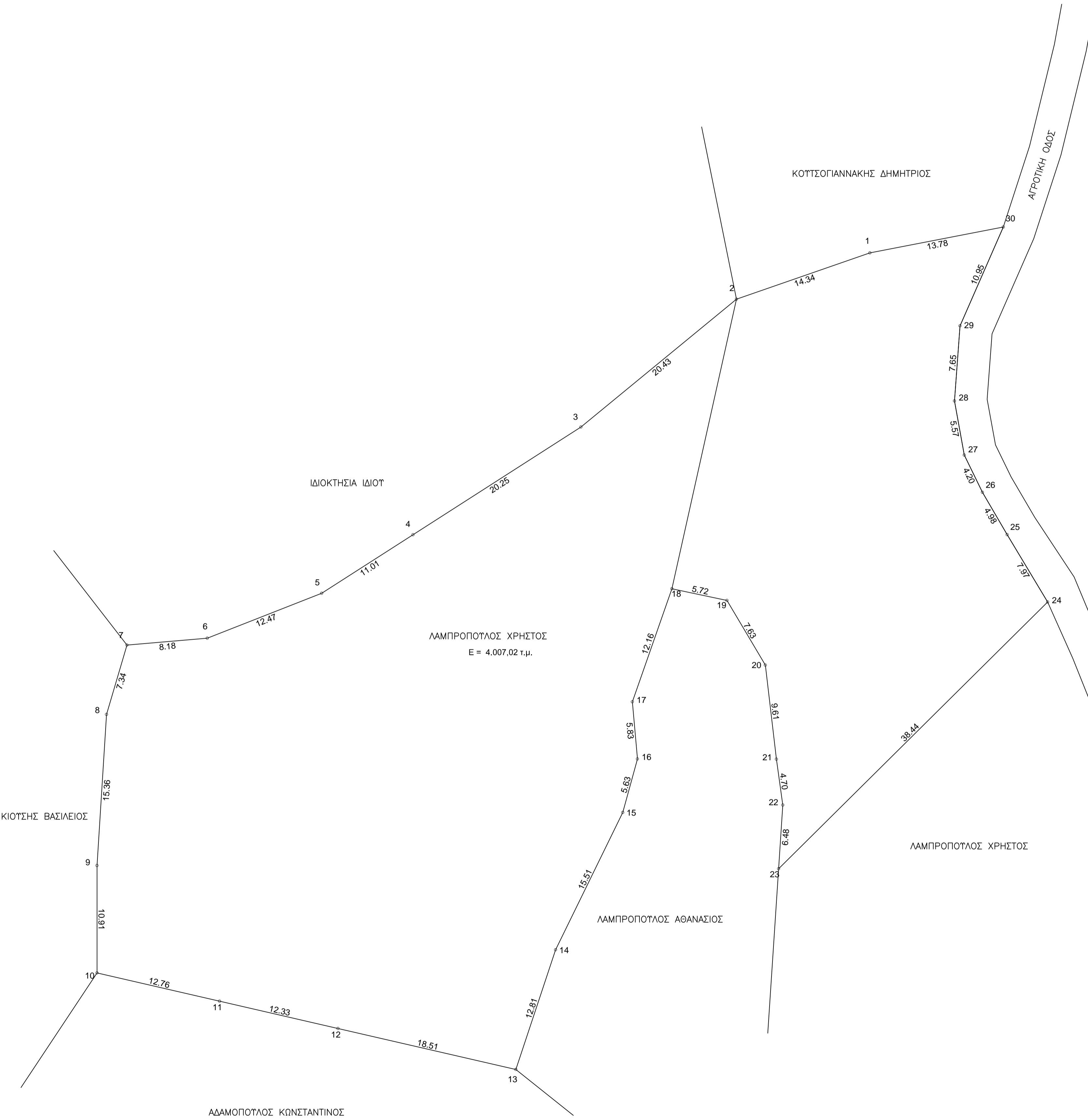
Πίνακας Συντεταγμένων των κορυφών του (1,2,3,...,29,30,1) σε ΕΓΣΑ'87 Εμβαδόν τετραγώνου = 4.007,02 τ.μ.