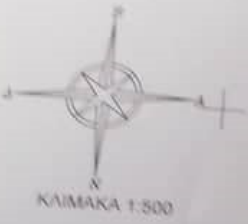
ΕΓΣΑΦ7 ΣΥΝΤΕΤΑΓΜΕΝΕΣ ΚΟΡΥΦΩΝ

21-11-2022 ΕΛΕΧΘΗΚΕ 21-11-2022 ΕΠΙΛΟΓΗ ΔΙΑΚΟΝΙΑ