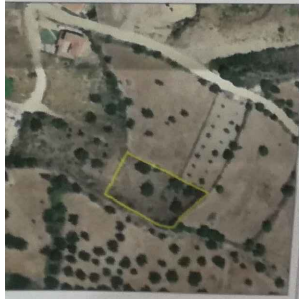
Απόσταση γήινη Γ.Χ.Σ. (6225-6) - Κλίμακα 1:5000