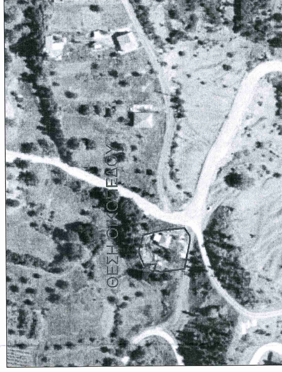
Απόσπασμα Ορθοφωτογραφίας ΕΚΧΑ Ευρυτέρας Περιοχής