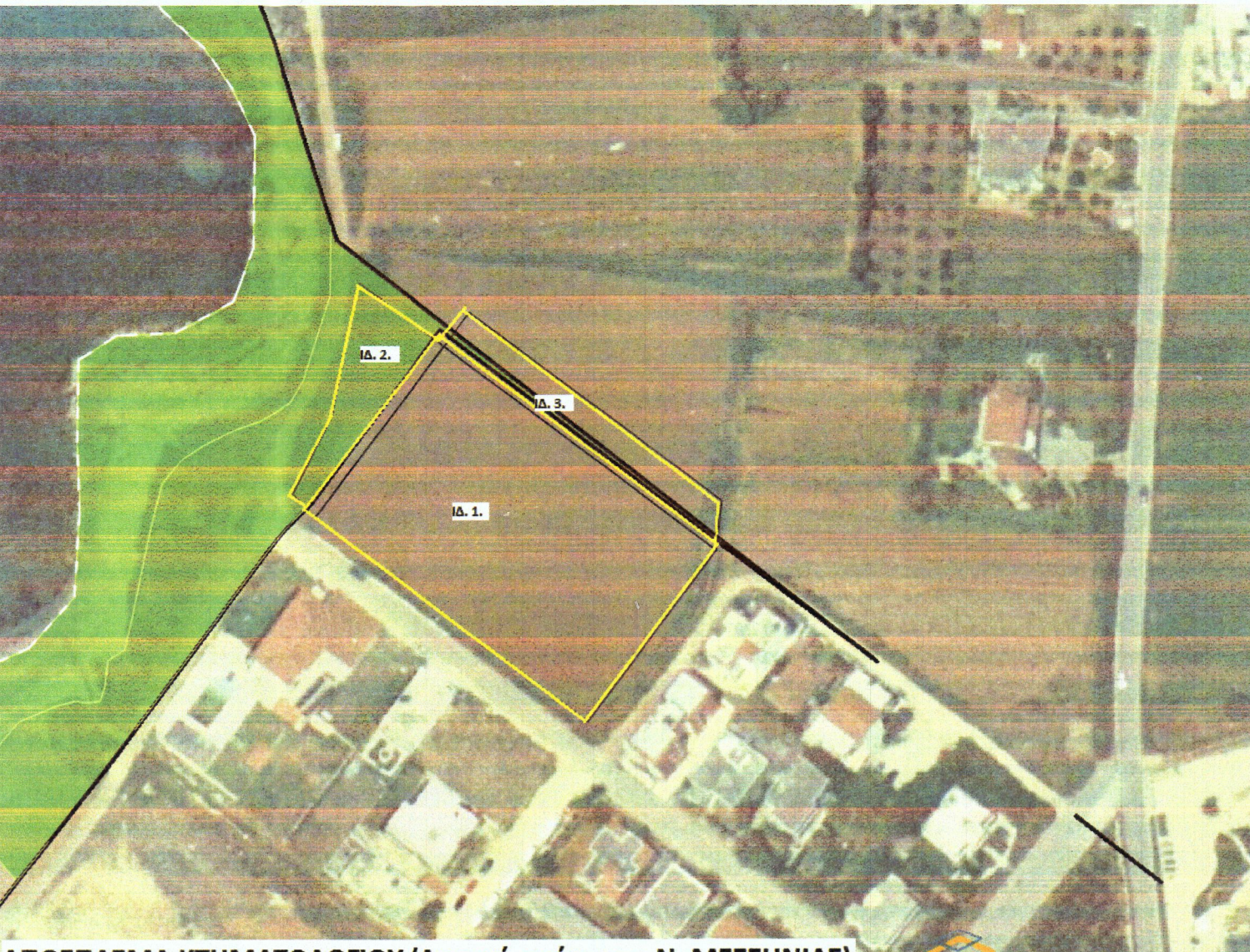
ΑΠΟΣΠΑΣΜΑ ΚΤΗΜΑΤΟΛΟΓΙΟΥ (Δασική ανάρτηση Ν. ΜΕΣΣΗΝΙΑΣ)

ΟΡΟΙ ΔΟΜΗΣΗΣ ( ΜΑΡΑΘΟΠΟΛΗ ΕΝΤΟΣ ΣΧΕΔΙΟΥ ) (Β.Δ. 25-8-1969 ΦΕΚ 164 Δ / 1-9-1969) ΑΡΤΙΟΤΗΤΑ : κανόνας E=400 μ2 Π=15 μ. παρέκκλιση (προ ΓΟΚ 1973) E=300 μ2 Π=13 μ. παρέκκλιση (προ Β.Δ. 25-8-1969) E=150 μ2 Π=8 μ. ΚΑΛΥΨΗ : 50% ΣΥΝΤΕΛΕΣΤΗΣ ΔΟΜΗΣΗΣ : 1,00 ΑΡΙΘΜΟΣ ΟΡΟΦΩΝ : 3 ΜΕΠΤΟ ΥΨΟΣ : 11μ.