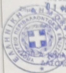
Αποσπασμα Χαρτη Κτηματολογου