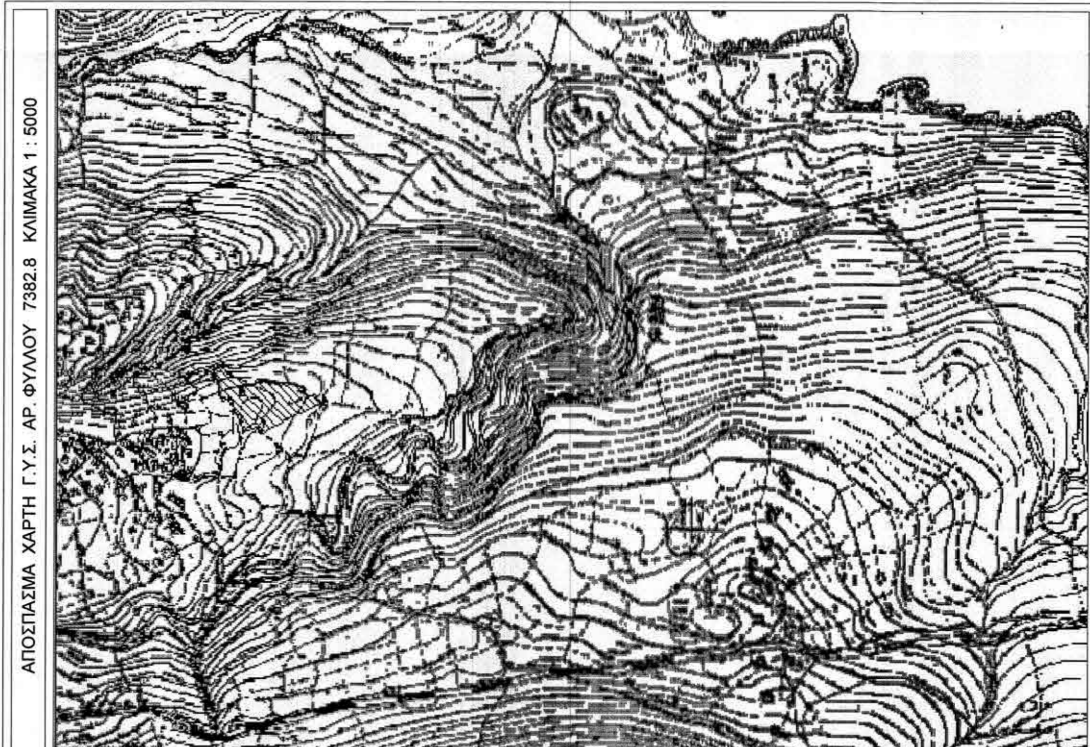
ΑΠΟΣΠΑΣΜΑ ΧΑΡΤΗ Γ.Υ.Σ. ΑΡ. ΦΥΛΛΟΥ 7382.8 ΚΛΙΜΑΚΑ 1:5000

ΤΟΠΟΔΟΜΙΚΗ ΛΑΚΩΝΙΑΣ Β. ΓΙΑΝΝΑΚΑΚΟΣ - Π. ΘΕΟΔΩΣΑΚΟΥ Ο.Ε. ΤΟΠΟΓΡΑΦΙΚΑ - ΜΕΛΕΤΕΣ - ΕΠΙΒΛΕΨΕΙΣ - ΚΑΤΑΣΚΕΥΕΣ Σκόκλα - Οδ. Β. Θεοδοσάκου Τηλ. (2735022260) fax. 2735022261