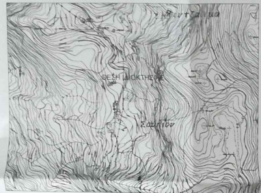
ΑΠΟΣΠΑΣΜΑ ΧΑΡΤΗ Γ.Υ.Σ. - ΑΡ. ΦΥΛΛΟΥ ΧΑΡΤΗΣ 6236-1