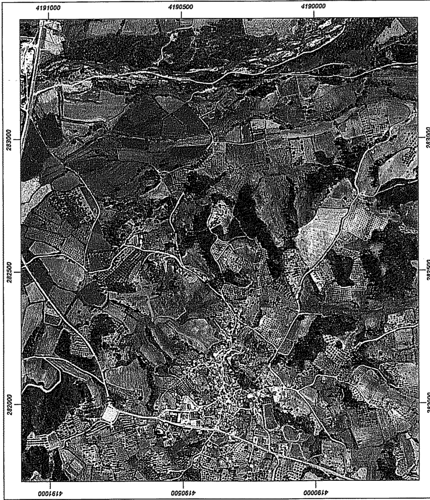
ΑΠΟΣΠΑΣΜΑ ΑΠΟ ΟΡΟΦΟΦΩΤΟΧΑΡΤΗ ΚΤΗΜΑΤΟΛΟΓΙΟΥ ΕΚΤΟΣ ΑΝΑΡΤΗΣΗΣ ΔΑΣΙΚΩΝ ΧΑΡΤΩΝ