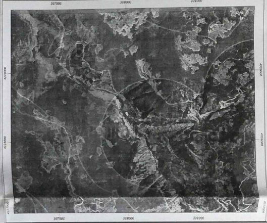
ΑΠΟΤΥΠΩΜΑ ΟΡΘΟΦΩΤΟΓΡΑΦΙΑΣ ΑΠΟ ΤΟΥΣ ΚΥΡΩΜΕΝΟΥΣ ΔΑΣΙΚΟΥΣ ΧΑΡΤΕΣ ΤΟΥ ΕΛΛΗΝΙΚΟΥ ΚΤΗΜΑΤΟΛΟΓΙΟΥ