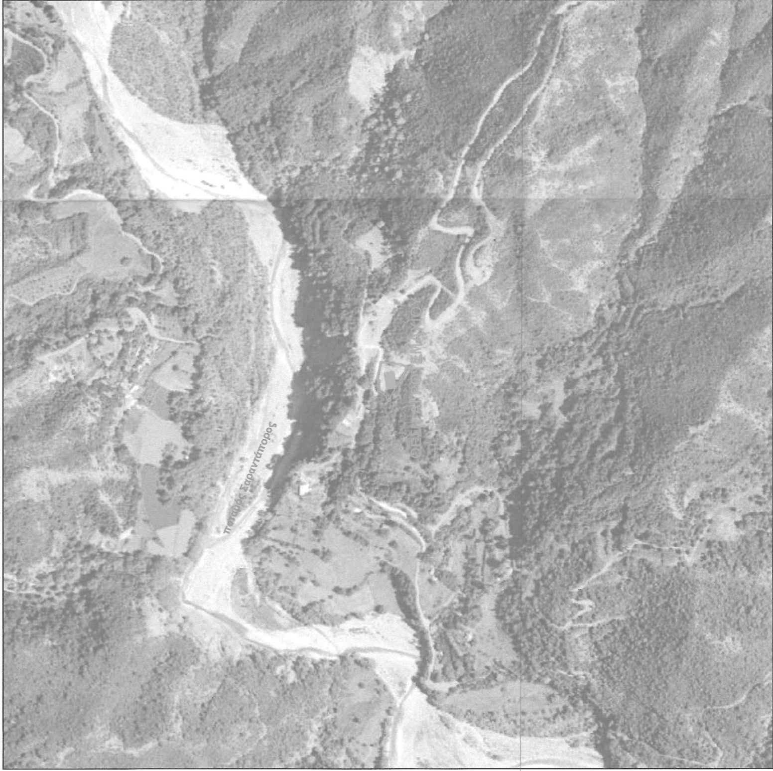
Απόσπασμα Ορθοφωτογραφίας ΕΚΧΑ Ειρύτερης Περιοχής Κλίμακα 1:5000