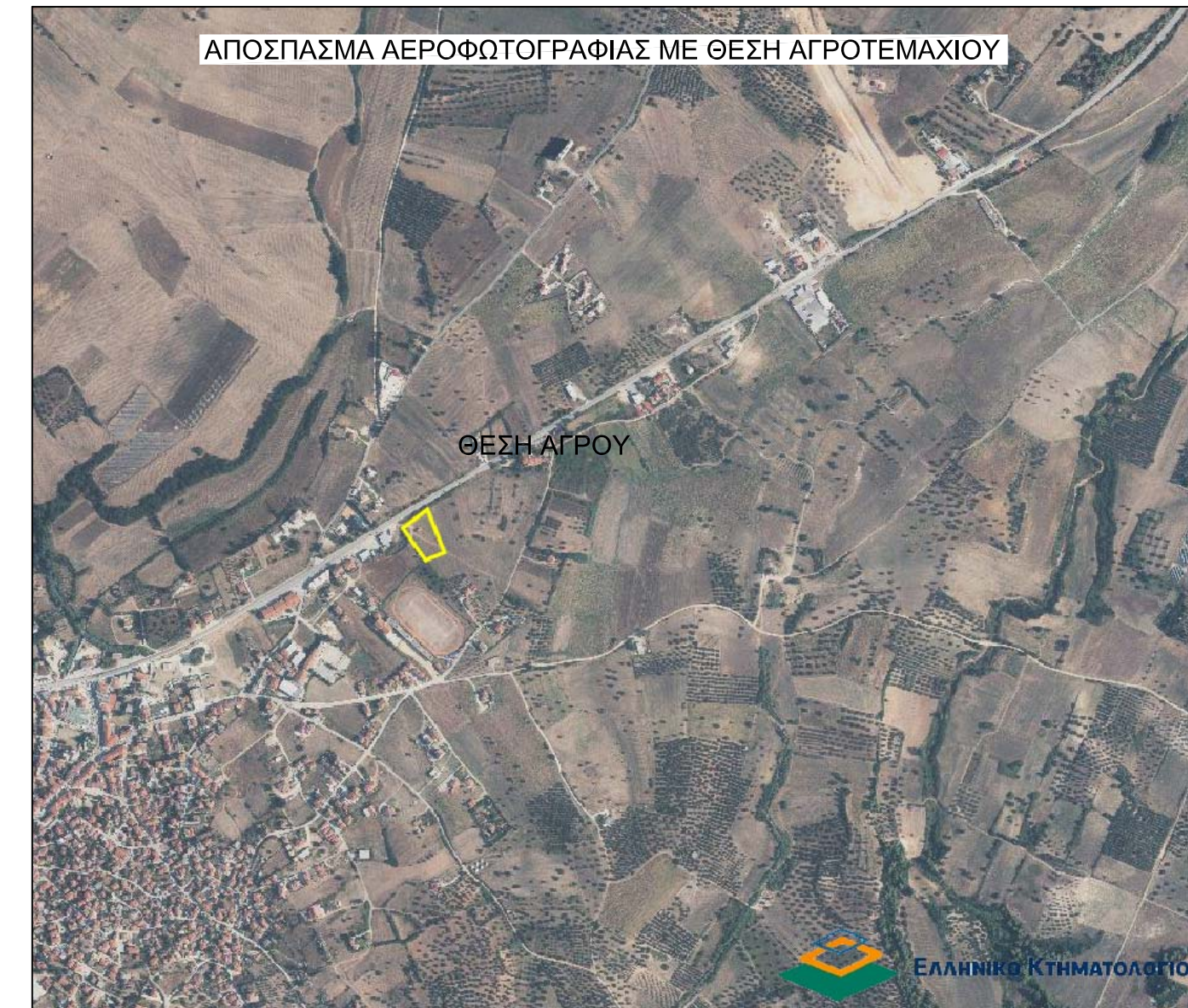
ΑΠΟΣΠΑΣΜΑ ΑΕΡΟΦΩΤΟΓΡΑΦΙΑΣ ΜΕ ΘΕΣΗ ΑΓΡΟΤΕΜΑΧΙΟΥ