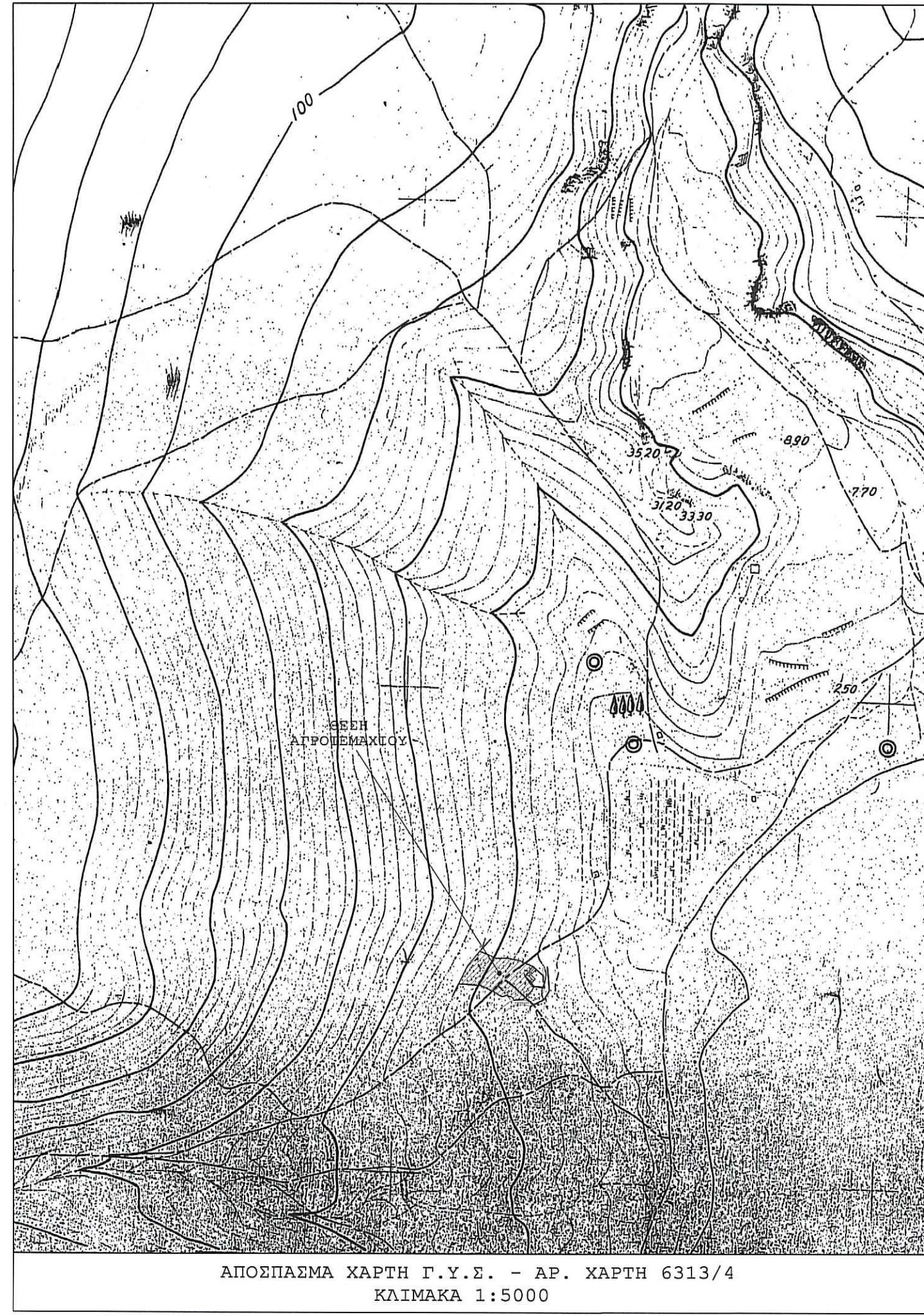
ΑΠΟΣΠΑΣΜΑ ΧΑΡΤΗ Γ.Υ.Σ. - ΑΡ. ΧΑΡΤΗ 6313/4 ΚΛΙΜΑΚΑ 1:5000