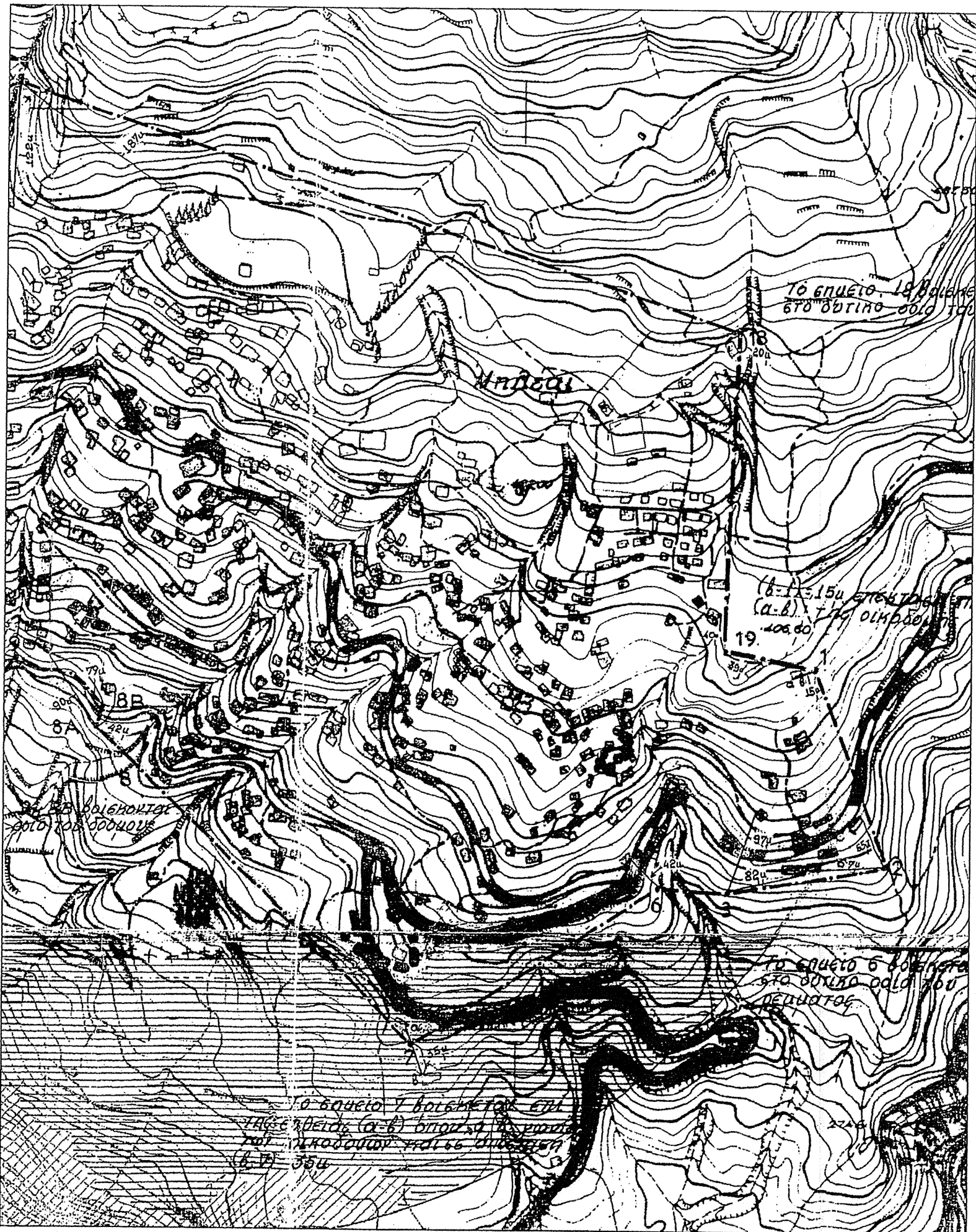
ΑΠΟΣΠΑΣΜΑ ΟΡΙΩΝ ΟΙΚΙΣΜΟΥ 1:5000