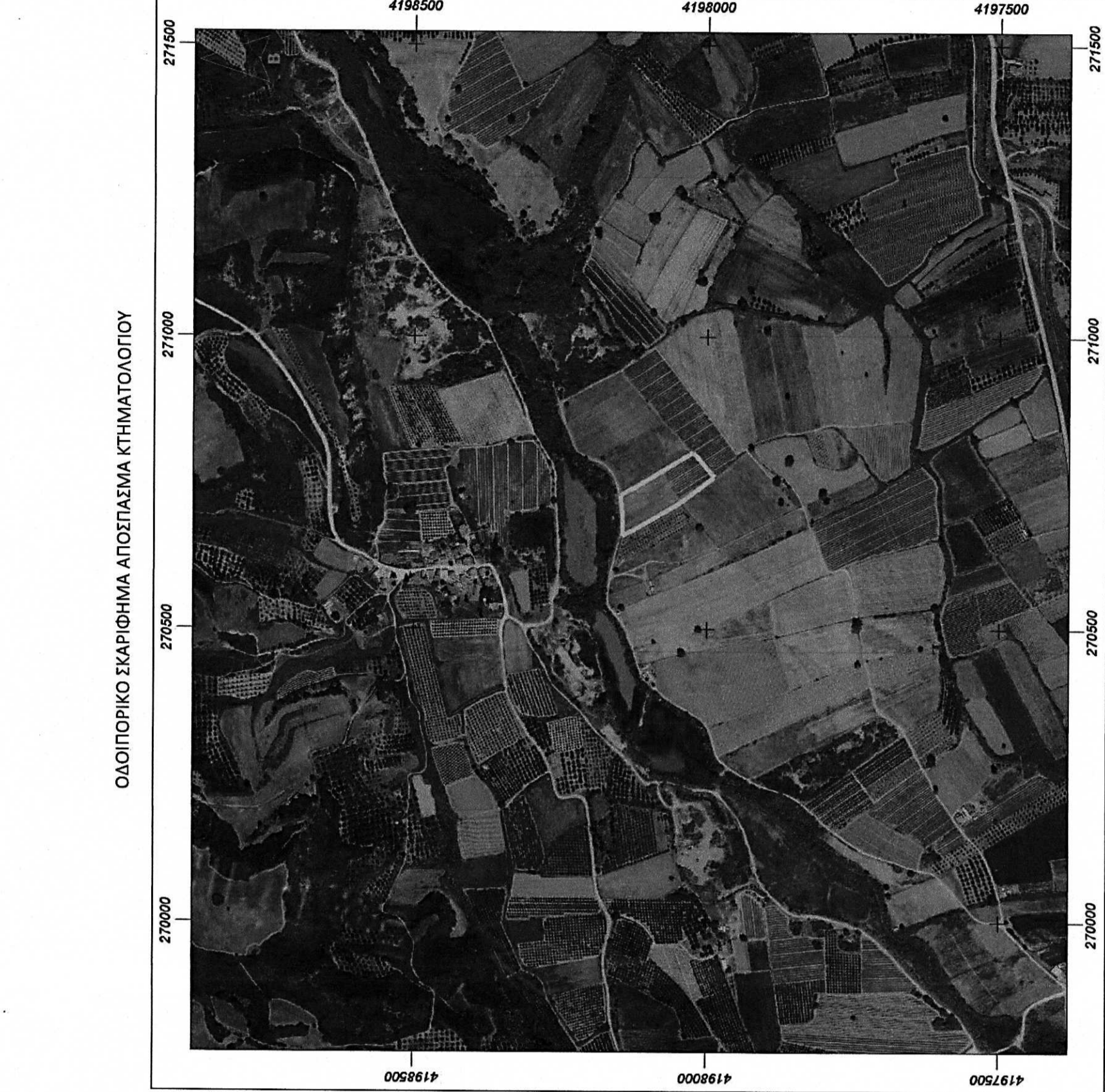
Απόσταση χάρτη Γ.Υ.Σ. (6251/8 Χ. - Αμαλιάδας), κλίμακας 1/5 000