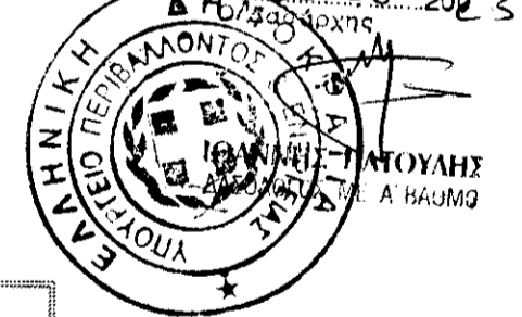
ΑΠΟΣΠΑΣΜΑ ΑΝΗΡΤΗΜΕΝΟΥ ΔΑΣΙΚΟΥ ΧΑΡΤΗ

ΘΕΩΡΗΘΗ θεωρείται το παρόν τοπογραφικό διάγραμμα με στοιχεία 1-2-5-3-4-6-1 που είναι ανεπίσημο τμήμα της αριθ. 322186/ 26-06-2023 πράξης χαρακτηρισμού του Δασαρχείου Αταλάνης. Αταλάνη 26-06-2023 ΝΙΚ. ΠΑΥΛΙΔΗΣ