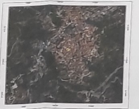
Ιδοκτησία Σταματία Χατζηγεωργίου