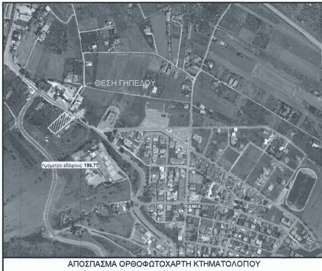
ΑΠΟΣΠΑΣΜΑ ΟΡΘΟΦΩΤΟΧΑΡΤΗ ΚΤΗΜΑΤΟΛΟΓΟΥ