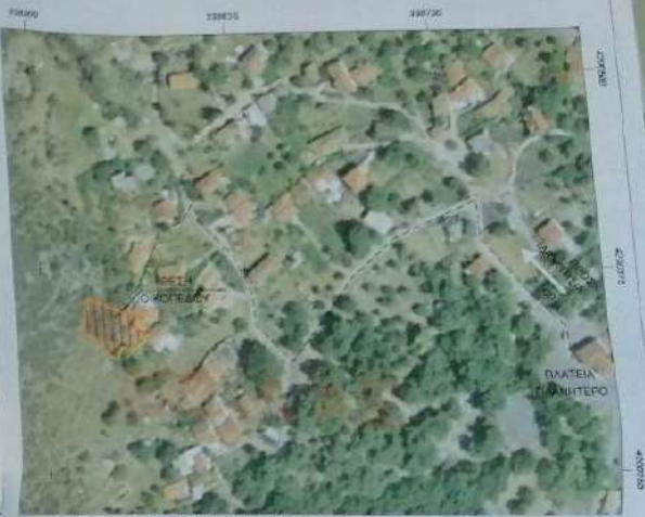
ΑΠΟΣΠΑΣΜΑ ΑΠΟ ΕΡΕΘΡΟΦΩΤΟΧΑΡΤΗΣ ΚΤΗΜΑΤΟΛΟΓΟΥ κ.τ. 2.300

ΝΙΚΟΛΑΟΣ Β. ΡΑΠΑΝΟΣ ΔΙΔΑΚΤΩΡ ΠΟΛΙΤΙΚΟΥ ΜΗΧΑΝΙΚΟΥ ΠΡΟΕΔΡΟΣ ΕΡΓΑΣΤΗΡΙΟΥ ΜΕΤΑΦΟΡΩΝ ΚΑΙ ΟΔΩΝ ΕΠΙΣΤΗΜΟΝΙΚΟ ΚΕΝΤΡΟ ΤΕΧΝΟΛΟΓΙΑΣ ΚΑΙ ΜΕΤΑΦΟΡΩΝ ΑΡΧΗΤΕΚΤΟΝΙΚΟ ΕΡΓ. ΚΑΙ ΣΧΕΔΙΑΣΜΟΥ