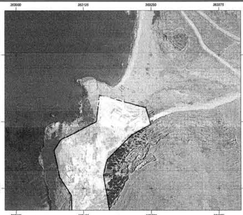
απόσπασμα ορθοφωτοχάρτη ΕΛΛΗΝΙΚΟΥ ΚΤΗΜΑΤΟΛΟΓΙΟΥ ΑΝΑΡΤΗΣΗ ΔΑΣΙΚΟΥ ΧΑΡΤΗ