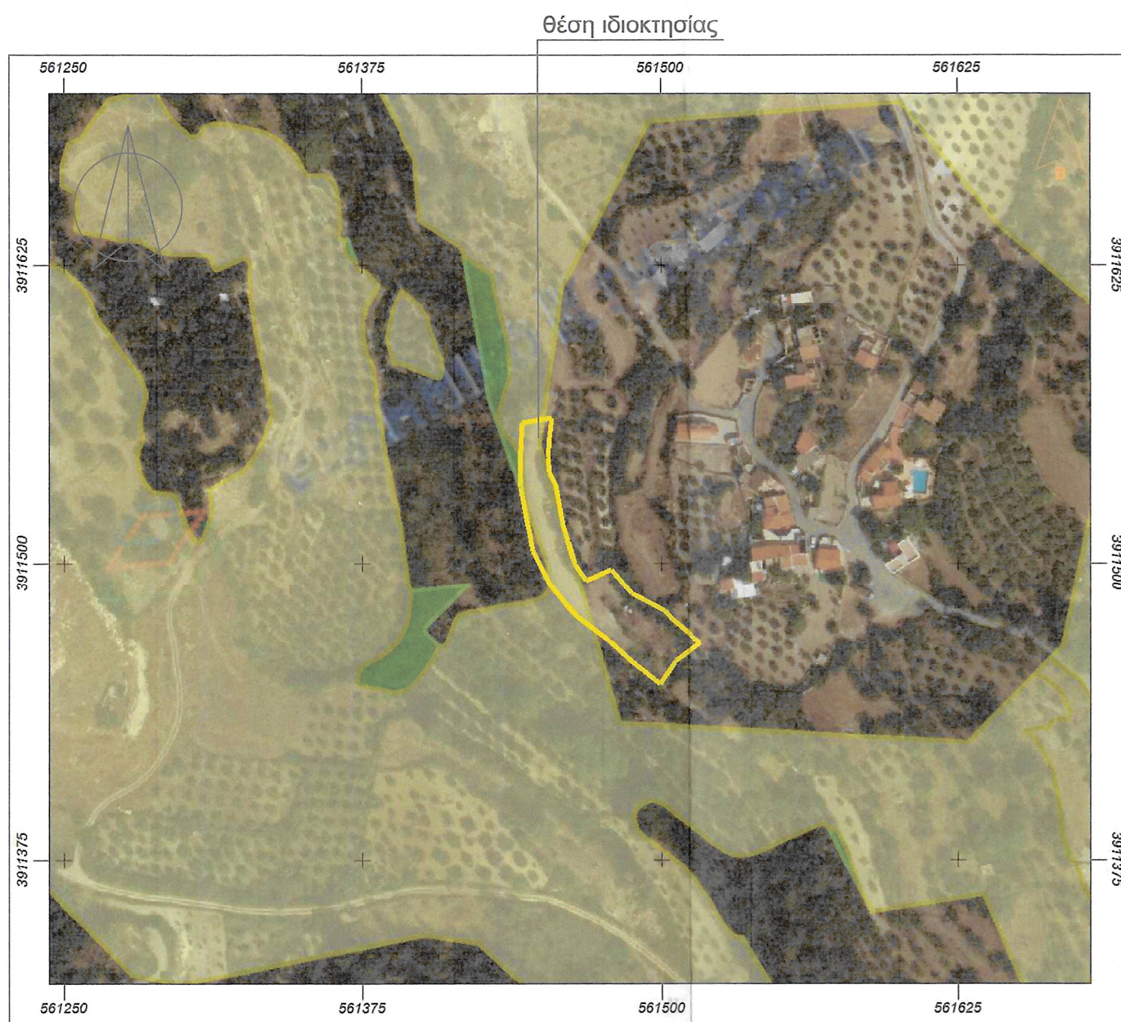
ΑΠΟΣΠΑΣΜΑ ΚΥΡΩΜΕΝΟΥ ΔΑΣΙΚΟΥ ΧΑΡΤΗ ΦΕΚ 922/Δ/30-11-2022