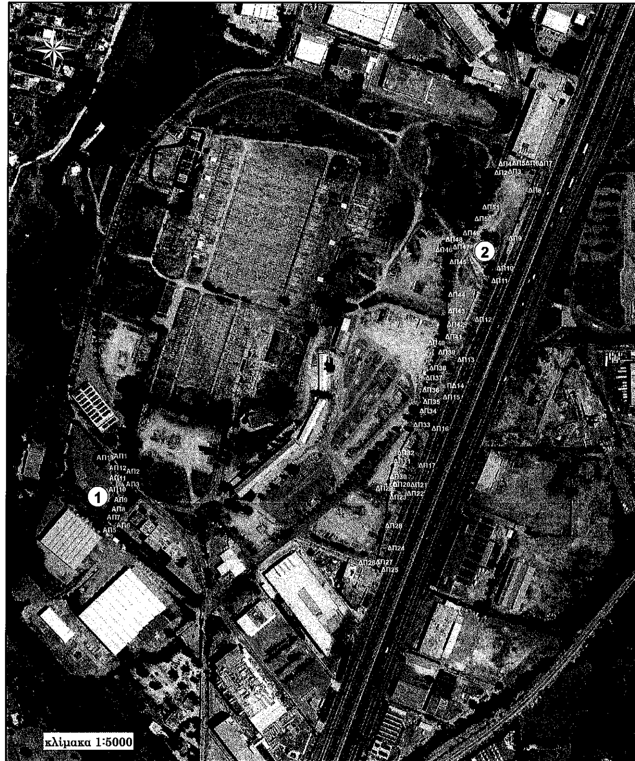
Πίνακας Συντεταγμένων Κορυφών ΕΓΣΑ'87