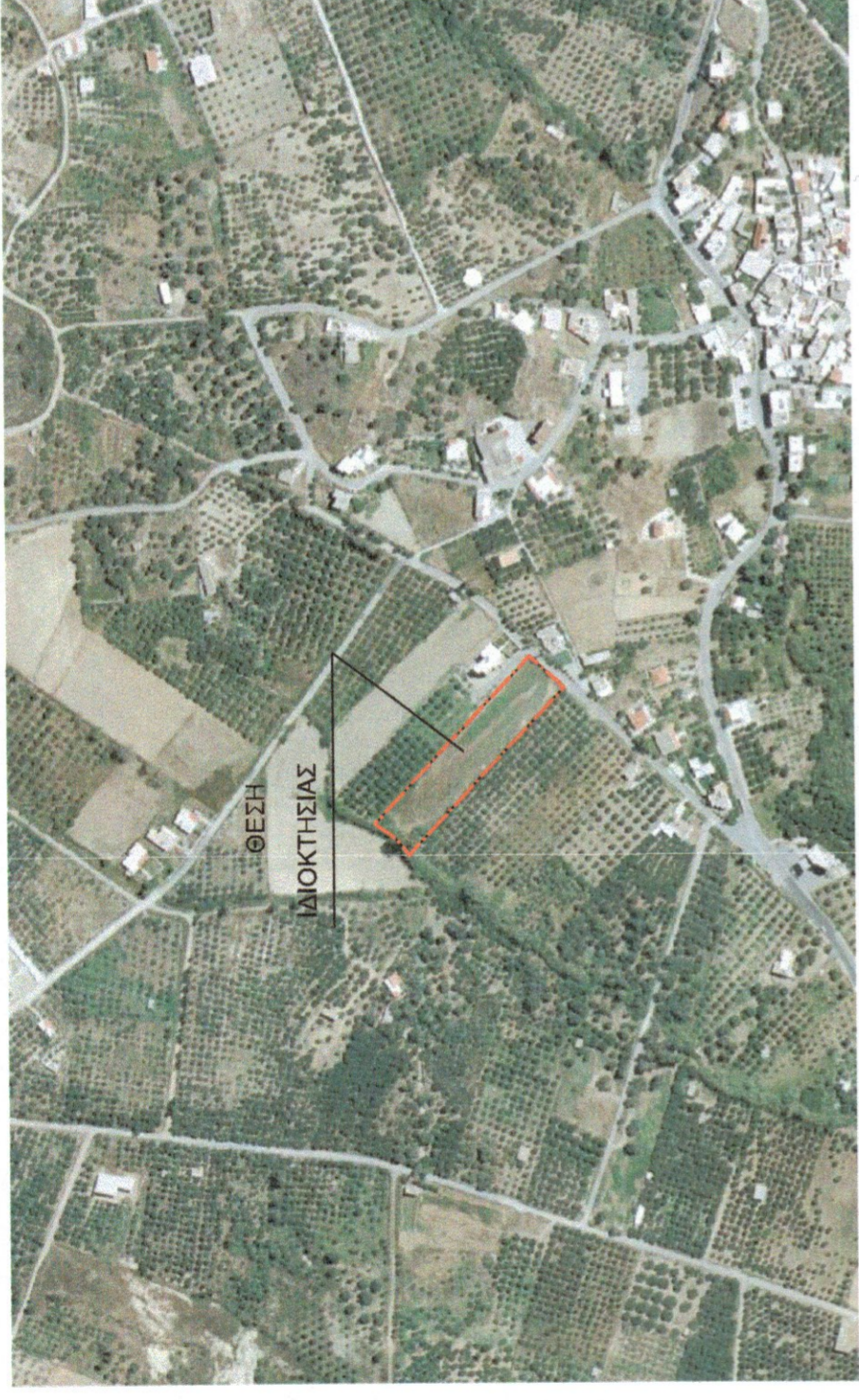
ΑΠΟΣΤΑΣΜΑ ΔΟΡΥΦΟΡΙΚΗΣ ΑΠΕΙΚΟΝΙΣΗΣ ΜΕ ΤΗΝ ΘΕΣΗ ΤΟΥ ΑΚΙΝΗΤΟΥ