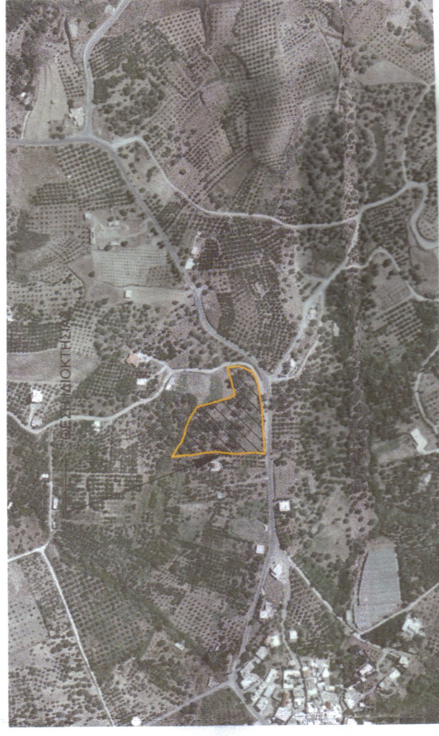
ΑΠΟΣΠΑΣΜΑ ΔΟΥΡΟΦΟΡΙΚΗΣ ΑΠΕΙΚΟΝΙΣΗΣ ΜΕ ΤΗΝ ΘΕΣΗ ΤΟΥ ΑΚΙΝΗΤΟΥ