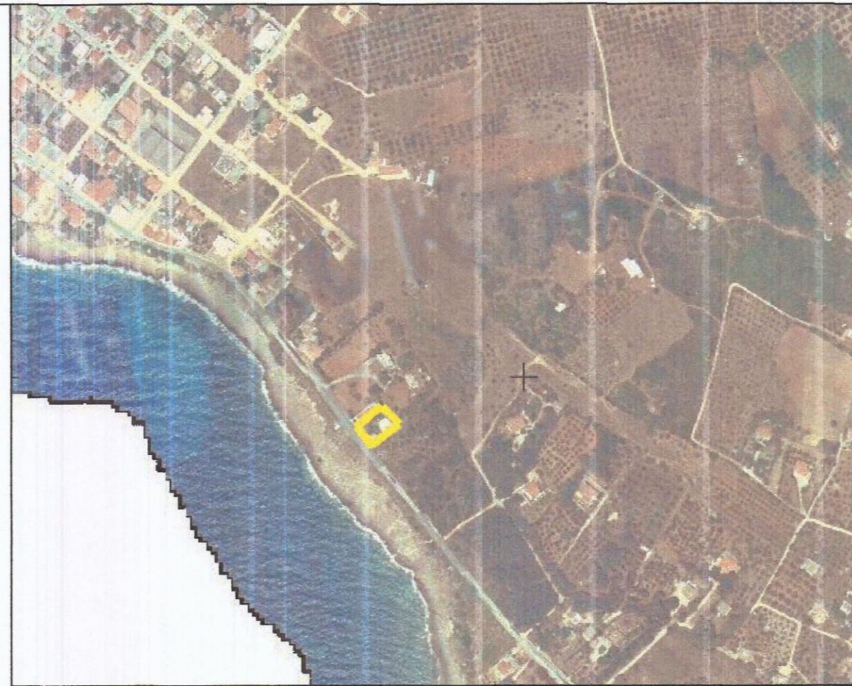
Απόσπασμα με όριο ιδιοκτησίας από Κτηματολόγιο ΑΕ περίοδο λήψης 2007-2009 κλίμακα 1/5000