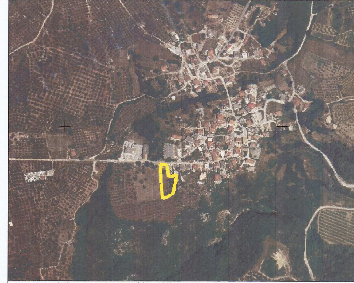
Απόσταση με άριο ιδιοκτησίας από Κτηματολόγιο ΑΕ περίοδο Μήνης 2015-2016 κλίμακα 1/5000