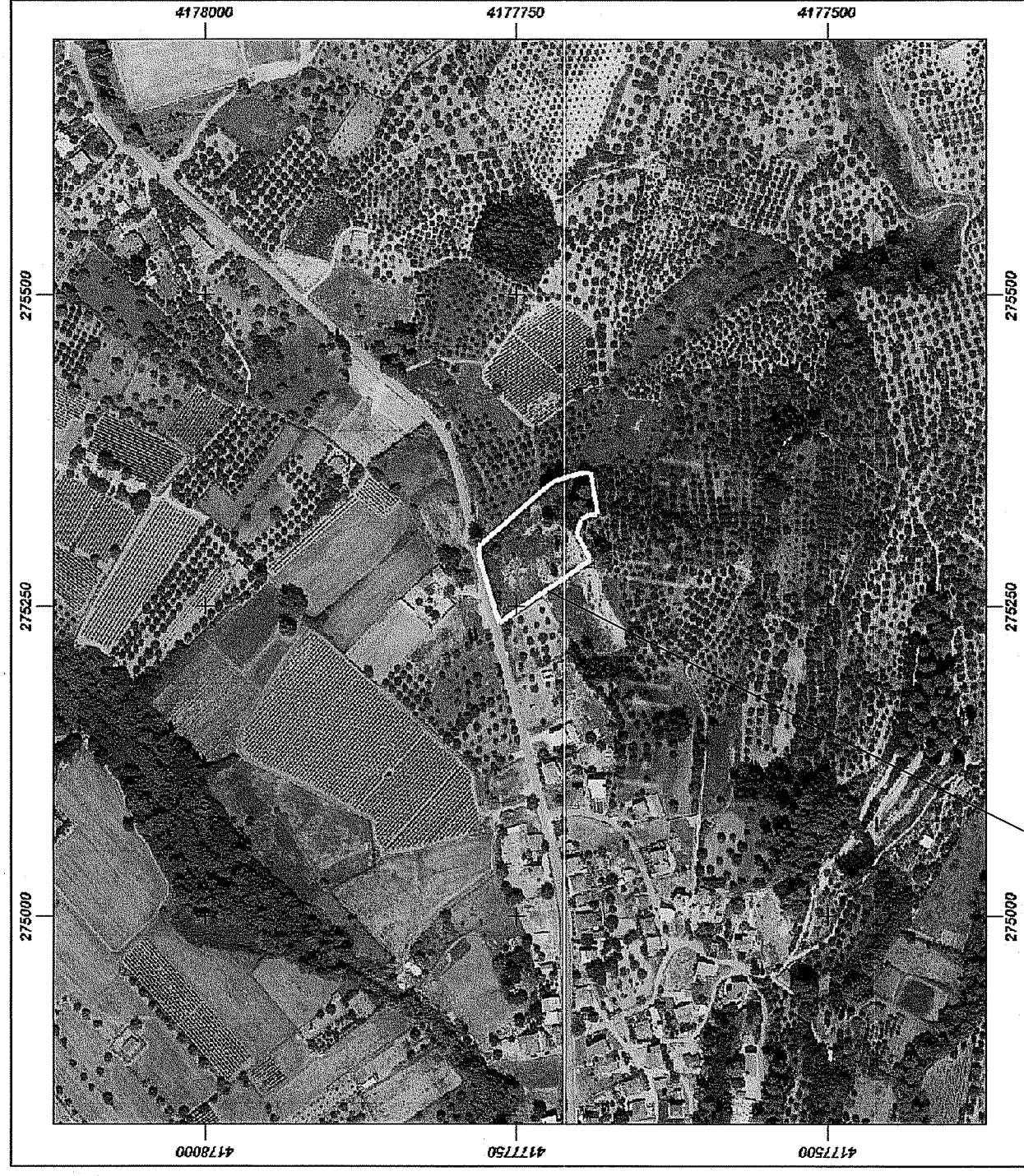
ΑΠΟΣΠΑΣΜΑ ΟΡΘΟΦΩΤΟΧΑΡΤΗ ΚΤΗΜΑΤΟΛΟΓΙΟΥ - ΙΔΙΟΚΤΗΣΙΑ ΤΖΙΑΝΤΖΗ