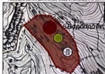
ΑΠΟΣΠΑΣΜΑ ΣΧΟΟΑΠ ΦΩΚ 1984/ΑΠ14-6-13

ΠΕΤΡΟΣ ΕΥΑΓΓ. ΧΟΝΔΡΟΥΔΑΚΗΣ Πτυχιούχος Γεωγράφος Αρμόδιος Γ.Ε. 227028988 ΑΕΠ 0331117 ΔΟΥ ΕΛΛΑΔΟΣ