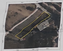
Φωτοαερο εικόνα του οικοπέδου