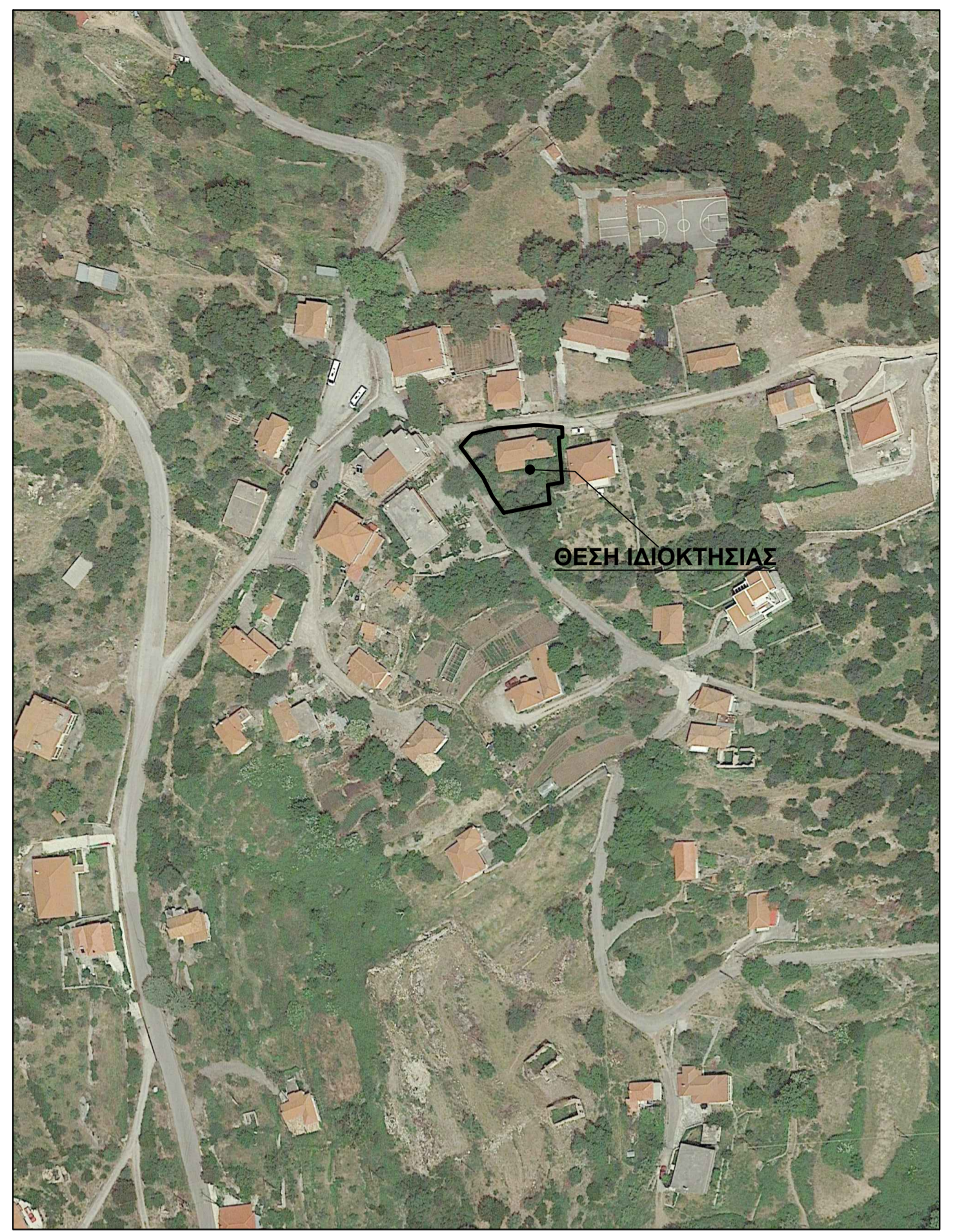
Απόσπασμα Δορυφορικού Χάρτη