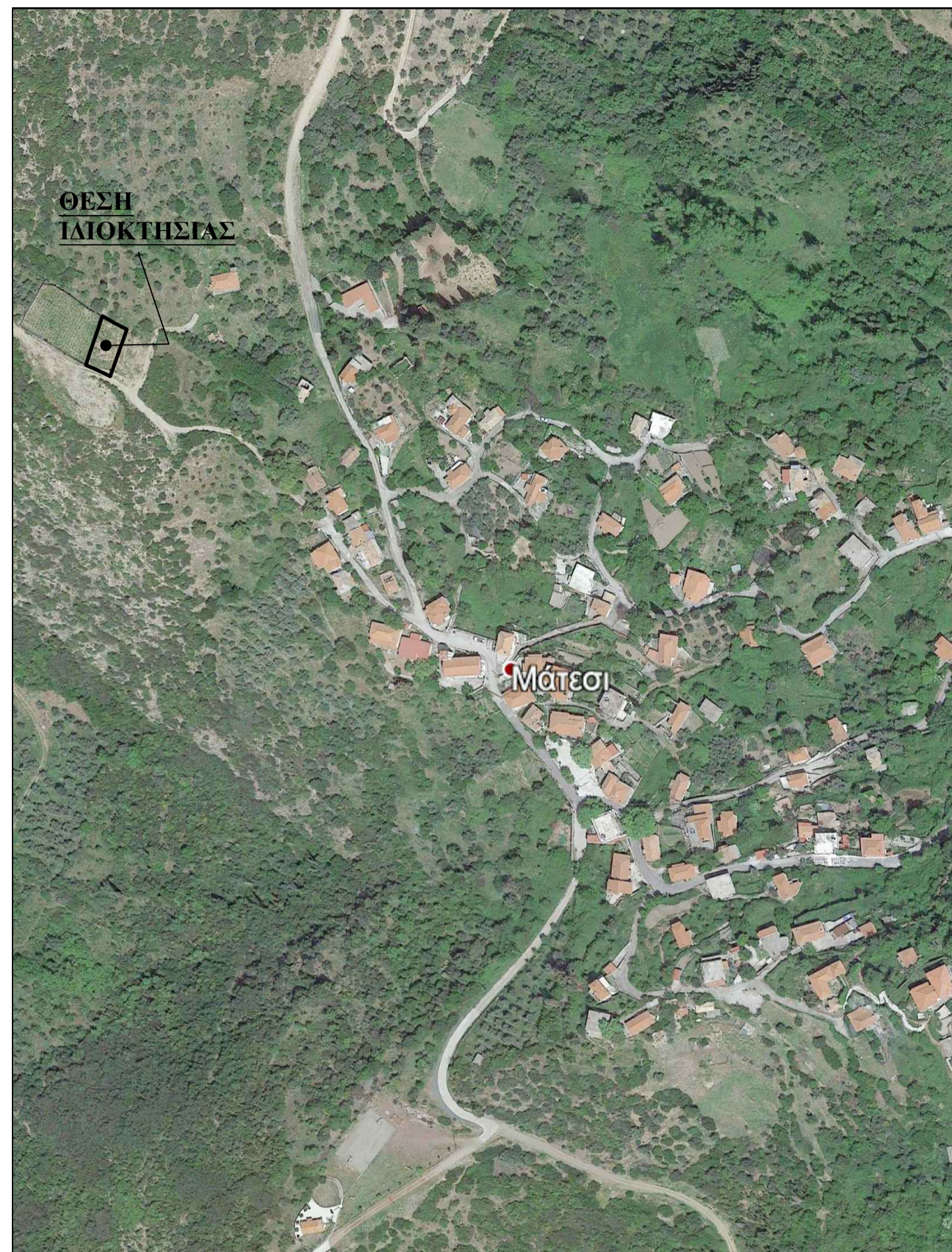
Απόσπασμα Δορυφορικού Χάρτη