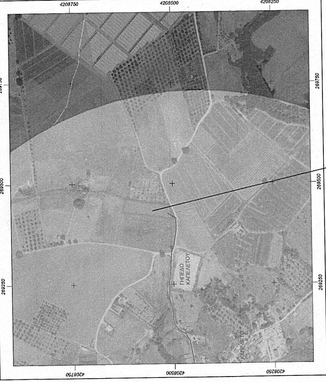
ΑΠΟΣΠΑΣΜΑ ΔΑΣΙΚΟΥ ΧΑΡΤΗ