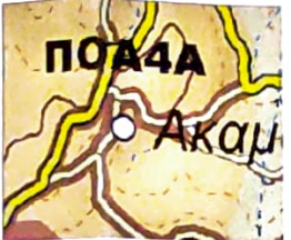
ΑΠΟΣΠΑΣΜΑ ΧΑΡΤΗ ΣΧΟΟΛΠ Δ.Ε. ΕΥΔΗΛΟΥ ΙΚΑΡΙΑΣ