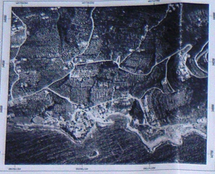
ΠΙΝΑΚΑΣ ΣΥΝΤΕΤΑΓΜΕΝΩΝ ΚΟΡΥΦΩΝ ΓΕΩΤΕΧΝΙΚΟΥ σ'ε ΕΓΣΑ 87*