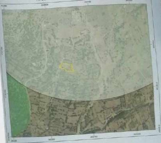
ΔΗΛΩΣΗ ΙΔΙΟΚΤΗΤΗ (Ν. 4630/2011)

Ο υπογεγραμμένος Ηλίας Ρεκουινιώτης του Γεραβουλάκη δηλώνει ότι τα όρια του γεωτεμαχίου με στοιχεία (Α1, Α2, ... Α19, Α1) εμβαδού 2403,82 m 2 που βρίσκεται εκτός ορίων οικισμού Λυκουριάς Τοπικής Κοινότητας Λυκουριάς Δημοτικής Ενότητας Κιλκίρας του Δήμου Καλαβρύτων, υπαχθούν από εδάφη.