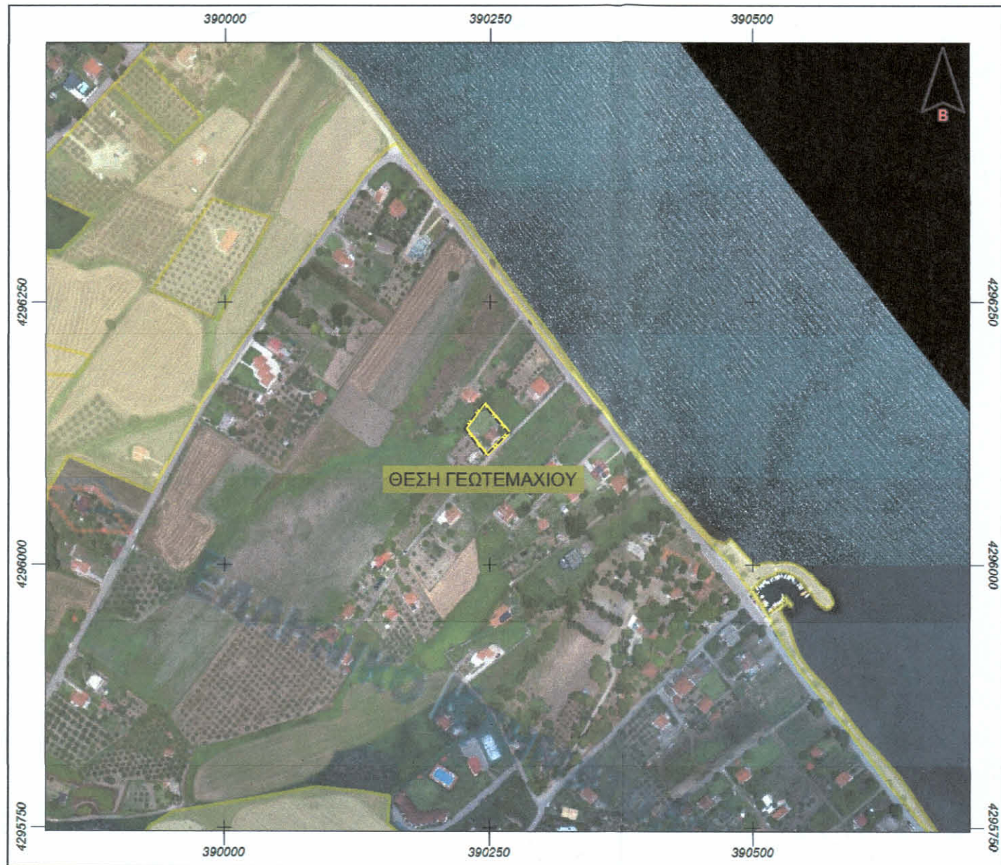
ΑΠΟΣΠΑΣΜΑ ΜΕΡΙΚΟΣ ΚΥΡΩΜΕΝΟΥ ΔΑΣΙΚΟΥ ΧΑΡΤΗ ΦΘΙΩΤΙΔΑΣ