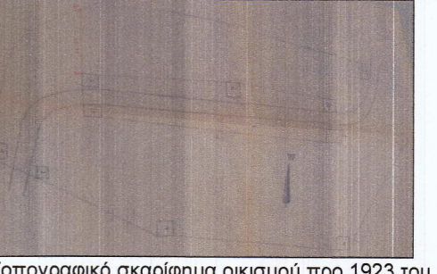
Τοπογραφικό σκαρίφημα οικισμού προ 1923 του 1970