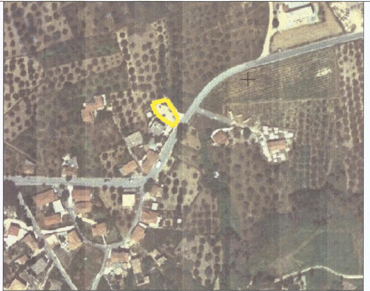
Απόσπασμα με όριο ιδιοκτησίας από Κτηματολόγιο ΑΕ περίοδο λήψης 2007-2009 κλίμακα 1/2000