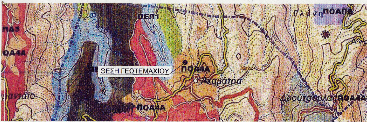
ΑΠΟΣΠΑΣΜΑ ΧΑΡΤΗ ΧΡΗΣΕΩΝ ΓΗΣ Δ.Ε. ΕΥΔΗΛΟΥ [ 15369/451/Φ.ΣΧΟΟΑΠ - ΦΕΚ 198Α.ΑΠ/2013 ] - ΚΛΙΜΑΚΑ 1:25000