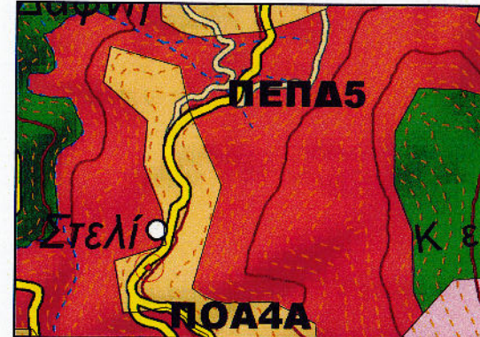
ΑΠΟΣΠΑΣΜΑ ΧΑΡΤΗ ΓΥΣ (ΑΡ.ΦΥΛΛΟΥ 6699-1)