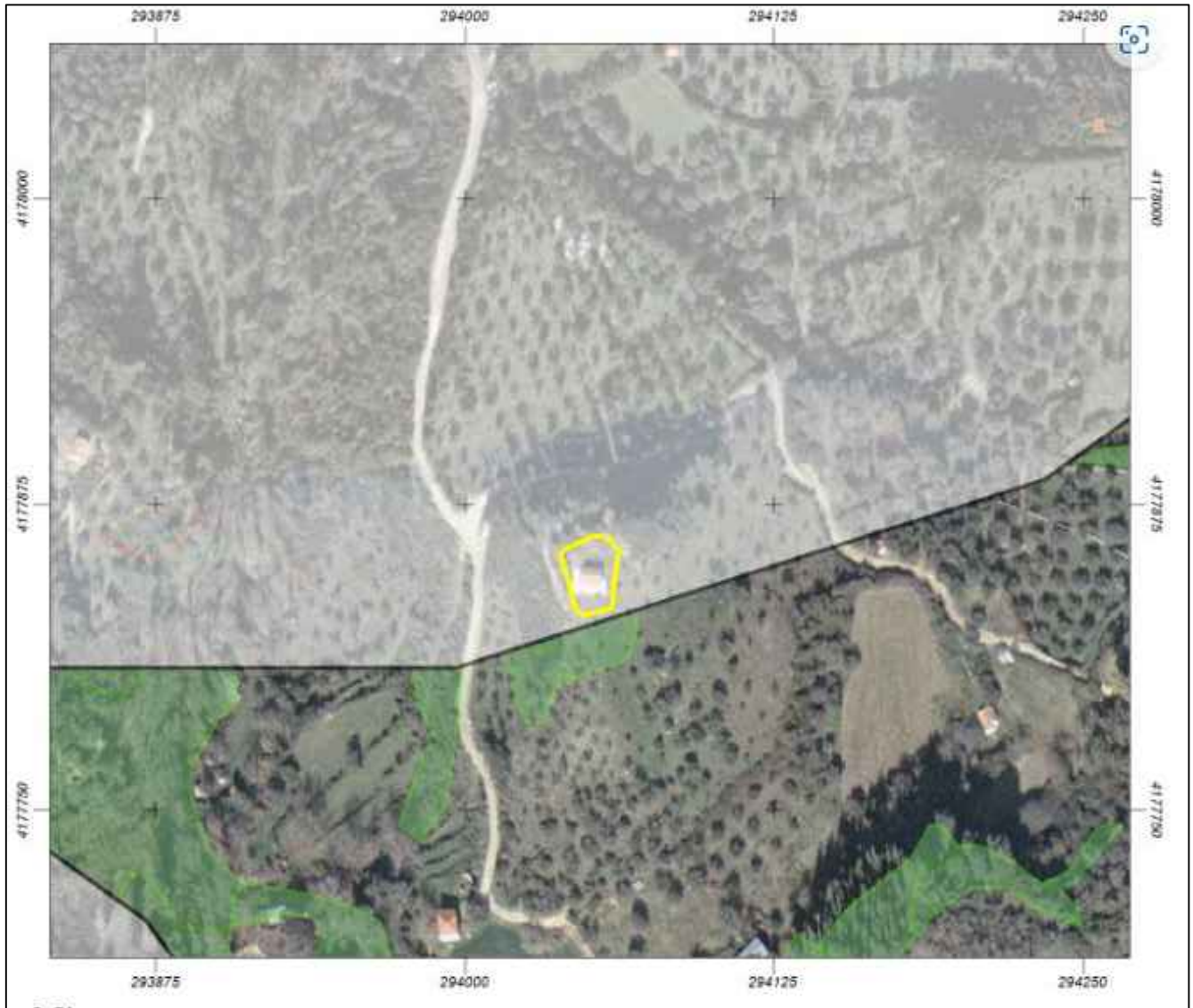
ΑΠΟΣΠΑΣΜΑ ΚΥΡΩΜΕΝΟΥ ΔΑΣΙΚΟΥ ΧΑΡΤΗ

ΒΑΣΙΛΕΙΟΣ Γ. ΖΑΧΑΡΟΠΟΥΛΟΣ ΠΟΛΙΤΙΚΟΣ ΜΗΧΑΝΙΚΟΣ Ε. Μ. Π.