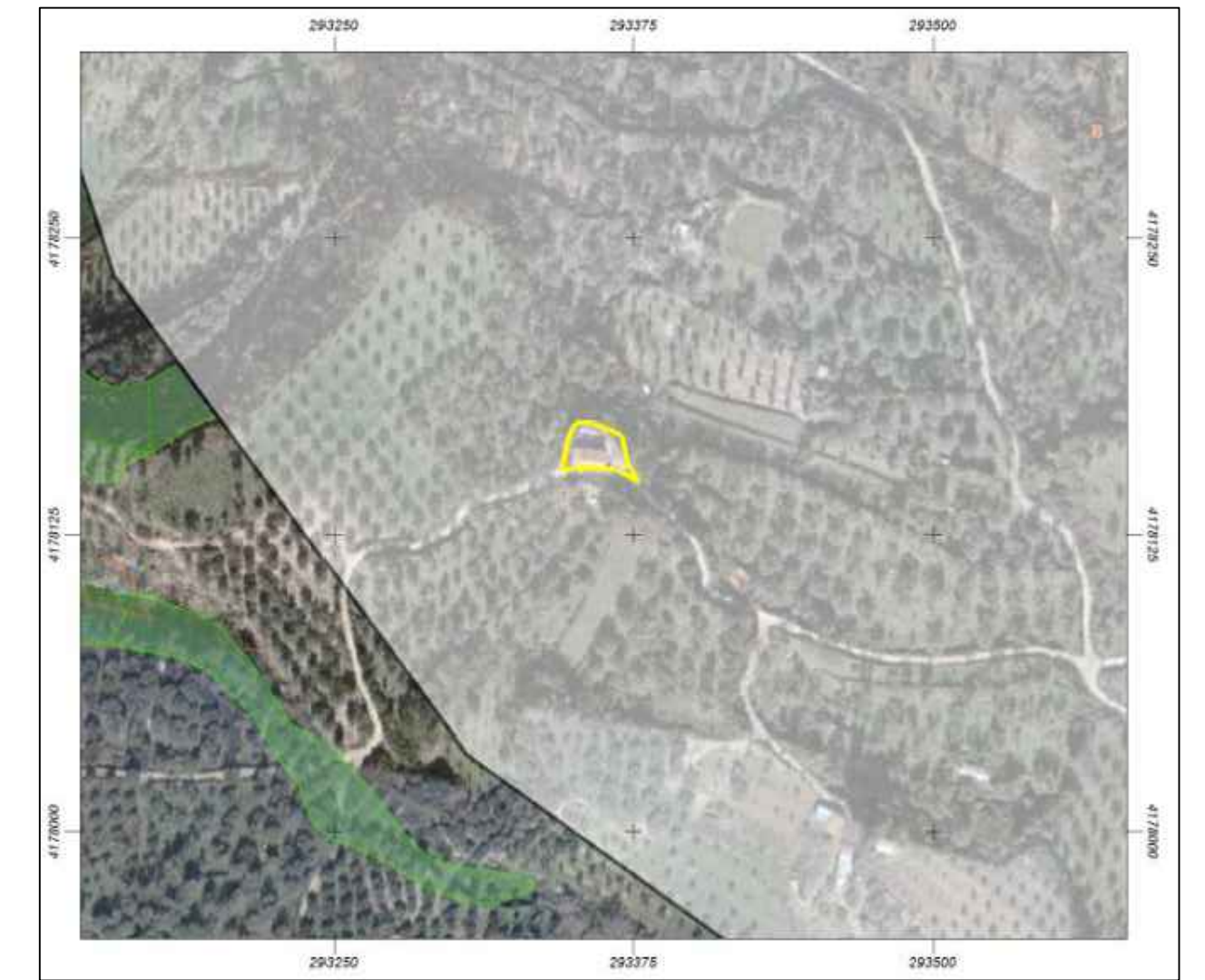
ΑΠΟΣΠΑΣΜΑ ΚΥΡΩΜΕΝΟΥ ΔΑΣΙΚΟΥ ΧΑΡΤΗ