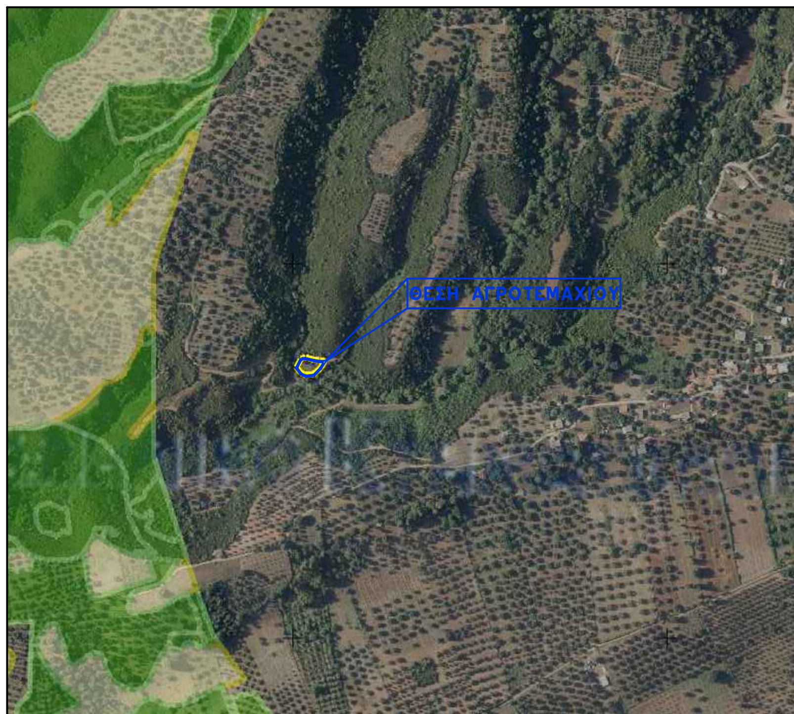
ΑΠΟΣΠΑΣΜΑ ΧΑΡΤΗ 1/50.000