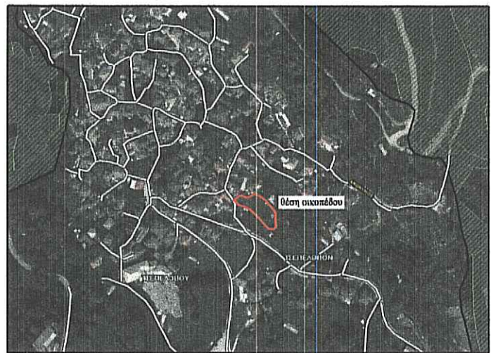
απόσπασμα οριστικής κυρωμένου Διατάχτη Χάρτη για την Π.Ε. Ιωαννίνων (υτ' αριθμ. 131933 απόφ. ΓΤΔ/ΥΠΗΘ ΦΕΚ 866 Δ' 24.11.22 και υτ' αριθμ. 134341 απόφ. ΓΤΔ/ΥΠΗΘ ΦΕΚ 867 Δ' 24.11.22)