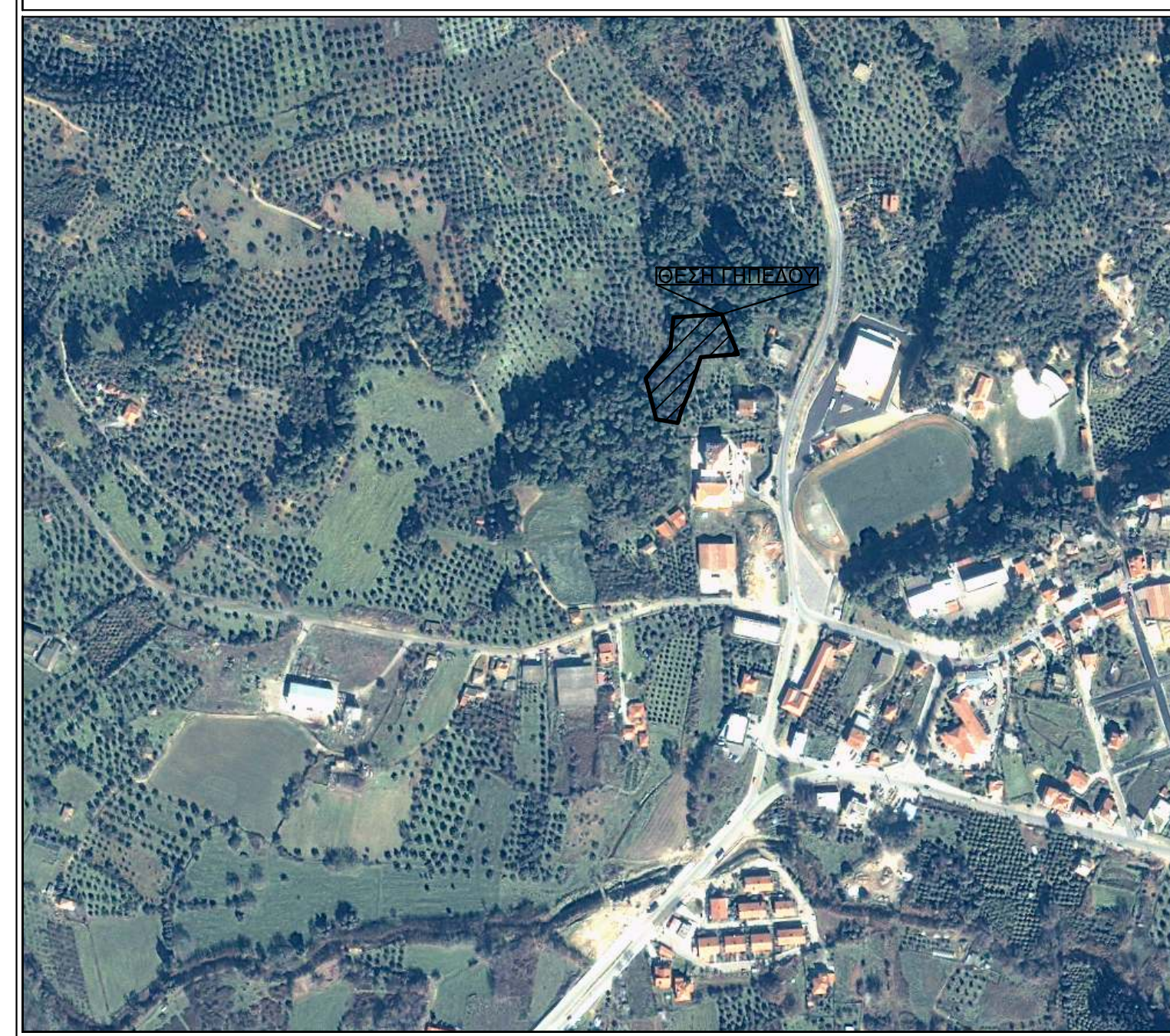
ΑΠΟΣΠΑΣΜΑ ΟΡΘΟΦΩΤΟΧΑΡΤΗ ΠΕΡΙΟΧΗΣ ΚΛ 1/5000

ΥΠΕΥΘΥΝΗ ΔΗΛΩΣΗ ΜΗΧΑΝΙΚΟΥ Ν. 1599/1986: Ο κάτωθι υπογεγραμμένος μηχανικός με ατομική μου ευθύνη και γνωρίζοντας τις κυρώσεις (3) που προβλέπονται από τις διατάξεις της παρ. 6 του άρθρου 22 του Ν. 1599/1986, δηλώνω ότι: - η έκταση που καταλαμβάνει το γήπεδο, όπως εμφανίζεται στο παρόν τοπογραφικό διάγραμμα ιδιοκτησίας, με στοιχεία "1-2-3-...-11-12-1" και με εμβαδόν 3588,15 m², βρίσκεται εκτός ανάρτησης του δασικού χάρτη της περιοχής αυτής. Ο ΜΗΧΑΝΙΚΟΣ