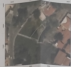
ΑΠΟΣΤΑΣΜΑ ΑΠΟ ΤΗΝ ΥΠΗΡΕΣΙΑ ΘΕΑΣΗΣ ΚΤΗΜΑΤΟΛΟΓΙΟΥ

ΘΕΩΡΗΘΗΚΕ και συνοδεύει το υπ' αρ. 255956/24 έγγραφό μας. Η Υπηρεσία μας δεν φέρει ευθύνη σε τυχόν εκν/κηση ή διεκδίκηση από τρίτους. 17/24