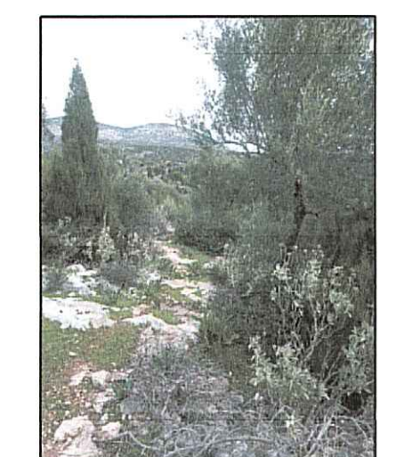
ΦΩΤΟΓΡΑΦΙΑ ΑΠΟ ΘΕΣΗ ΛΗΨΗΣ 1

4245580 Ιδιοκτησία Αγνώστου με αρ. ΚΑΕΚ 480202403441