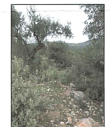
ΦΩΤΟΓΡΑΦΙΑ ΑΠΟ ΘΕΣΗ ΛΗΨΗΣ 2