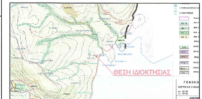
ΑΠΟΣΠΑΣΜΑ ΧΑΡΤΗ Γ.Π.Σ Δ.Ε. ΔΕΣΦΙΝΑΣ