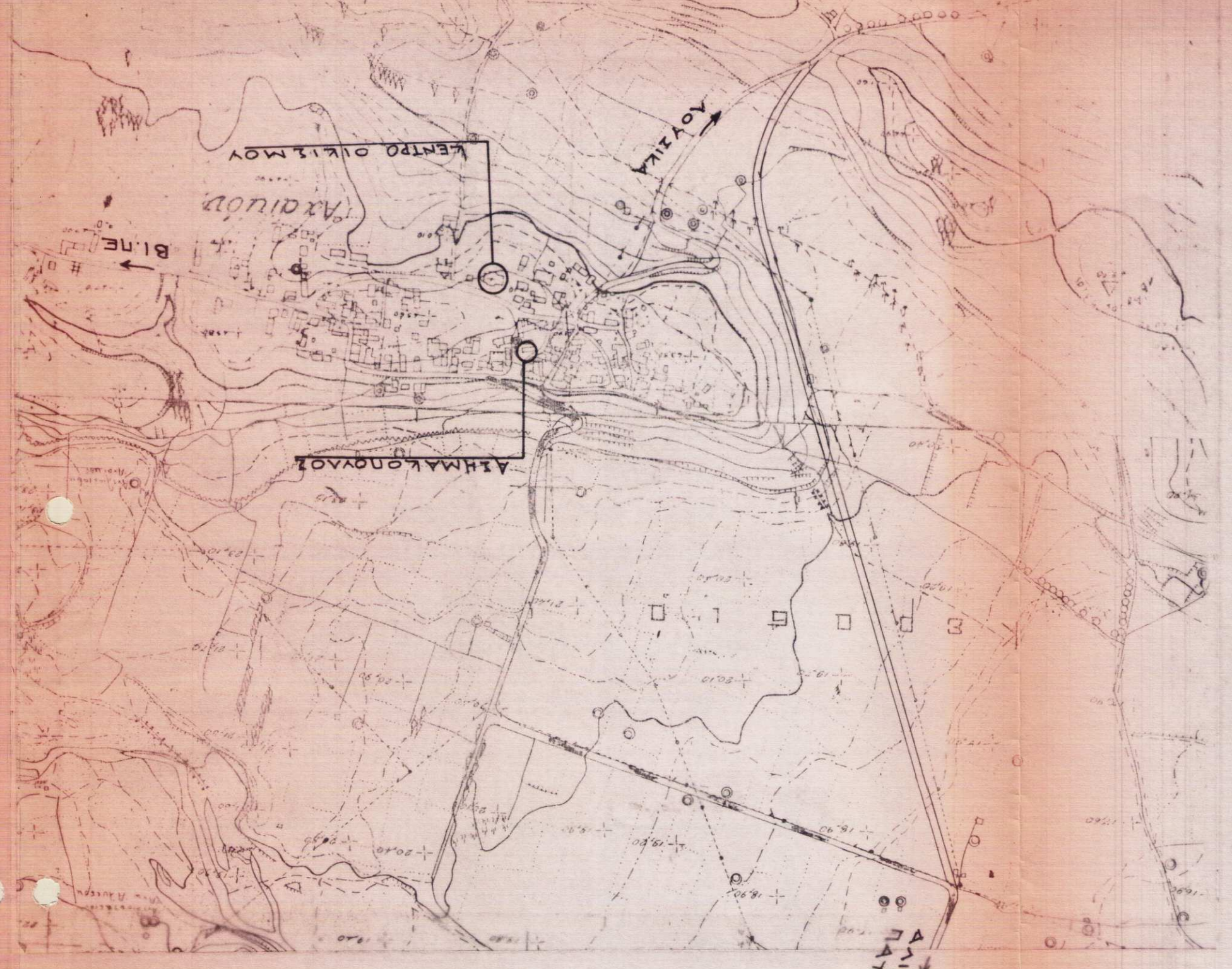
ΟΔΟΝΟΜΙΚΟ ΚΑ. 1:5000