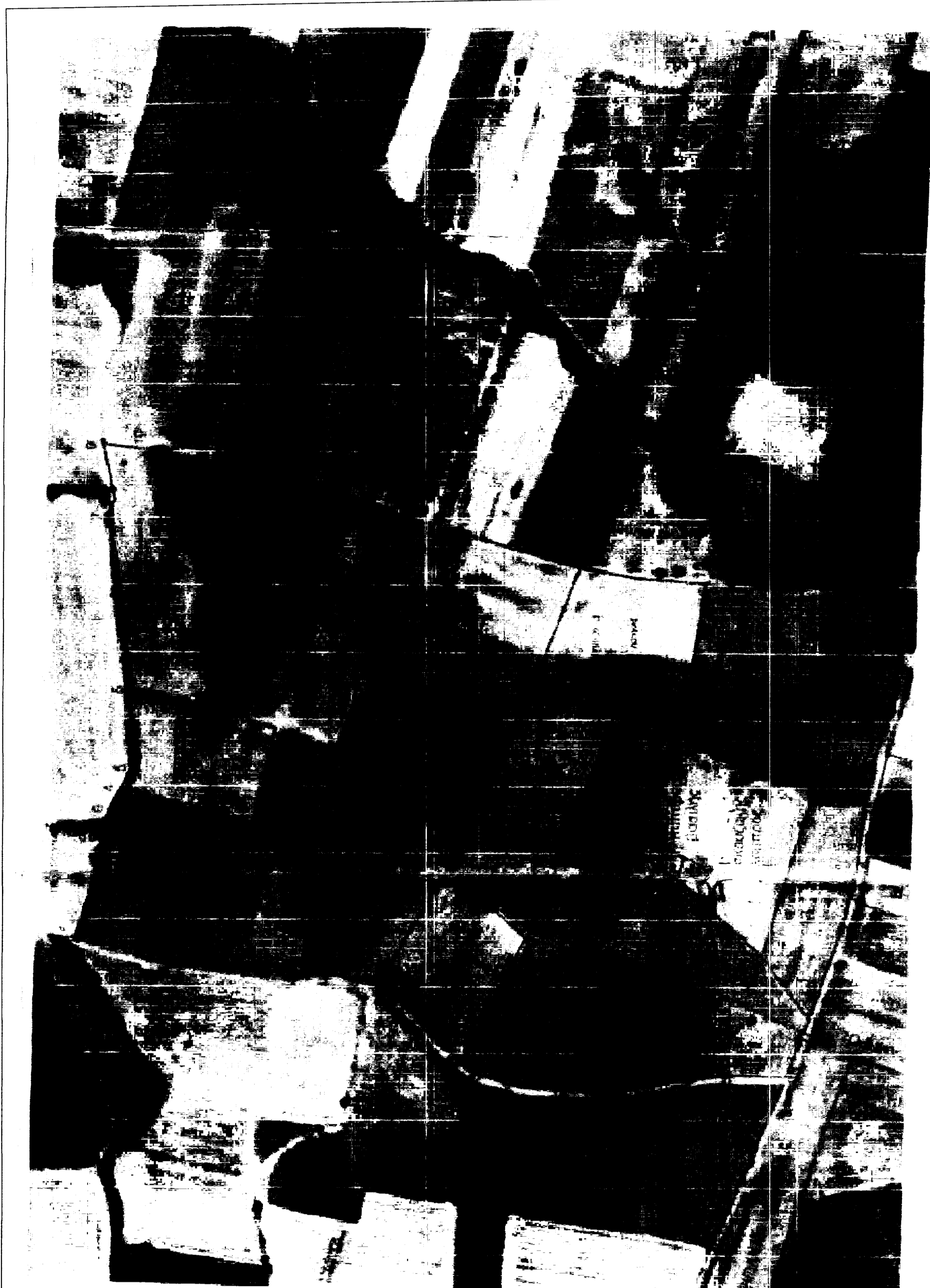
ΑΠΟΣΠΑΣΜΑ ΟΡΘΟΦΩΤΟΧΑΡΤΟΥ ΚΛΙΜΑΚΑ 1/2000