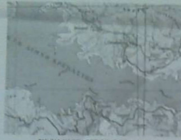
ΤΜΗΜΑ ΧΑΡΤΗ ΠΕΡΙΟΧΗΣ (ΣΚΑ 1:50.000)